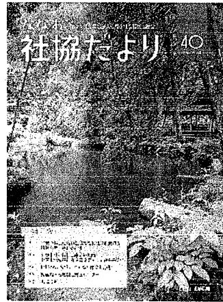
40号 (H26.7 発行)