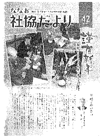
42号 (H27.1 発行)