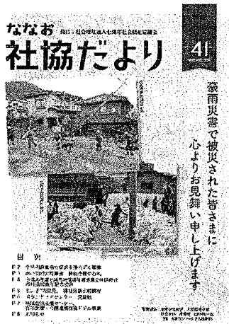
41号 (H26.10 発行)