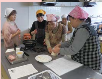
▶ 高齢者向け調理研修会