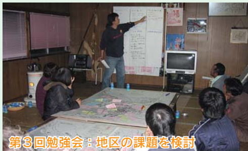
第3回勉強会：地区の課題を検討