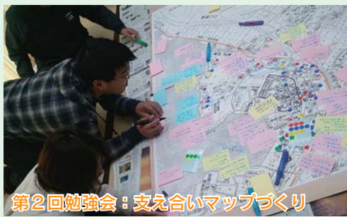
第2回勉強会：支え合いマップづくり