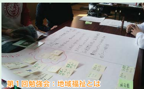
第1回勉強会：地域福祉とは

第一回勉強会（10月11日）では、「地域福祉とは何か？」を考え、グループワークで理想とするまちの姿を探りました。第二回勉強会（11月18日）では支え合いマップづくりを実践し、地域に住んでいる方の関わりや社会資源を探りました。第三回勉強会（12月1日）では第二回で作成した支え合いマップで明らかにした課題や地域の「気になること」の解決法、地域の気になる人のリスト作成と関わり方を検討し、チーム小牧を中心に町会で取り組んでいくことを方針として確認しました。今後の活動展開を期待します。