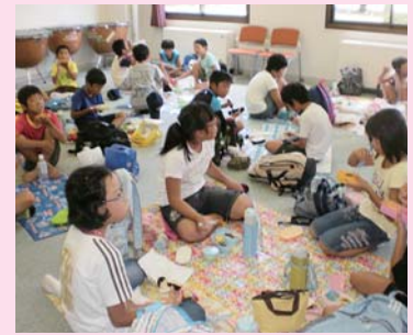
みんなで、 お弁当食べたね！

今年初めて、七尾市の5つの児童館のお友だちが、石川県消防学校で消火体験をしたりいしかわ交流センター金沢館でとプラネタリウムを見たりしたよ！