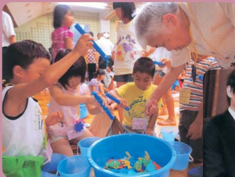
▲ 放課後児童クラブ 高齢者と児童の交流事業