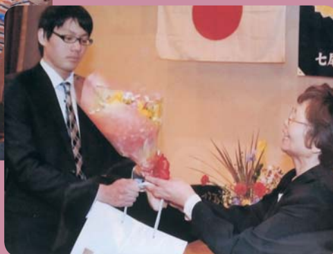
▼ 手をつなぐ育成会 成人式

民間・自主運営放課後児童クラブ事業、障がい児療養活動、防犯・交通安全パトロール活動、防災研修、地区の敬老会など、一人暮らし高齢者へのお弁当づくり、七尾市内15地区の地域によって使いみちは異なります。