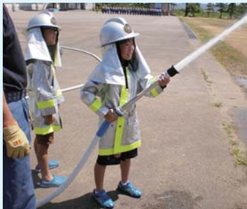
ちびっ子消防士 放水始め！